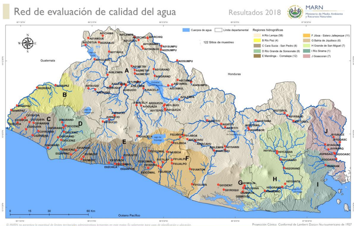
Figura 1. Red de sitios para la evaluación de la calidad de agua de los ríos a escala nacional

En el siguiente mapa se presenta los sitios de muestreos de calidad de agua para las diez Regiones Hidrográficas del país.