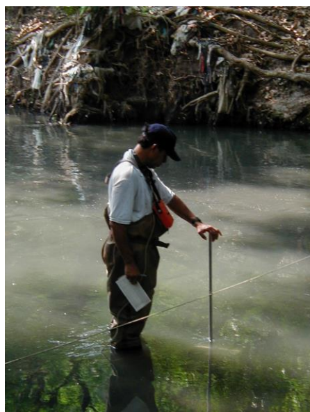
Figura 8. Medición de la velocidad de la sección parcial por unidad de tiempo

En cada uno de los sitios de la red de monitoreo se midió cantidad de agua a través del método aforo por vadeo. El aforo es la operación de medición del caudal en una sección de un curso de agua, en los ríos se mide en forma indirecta, determinando la velocidad de la corriente con un molinete o correntómetro y teniendo en cuenta que el caudal es igual a la velocidad del flujo en la sección multiplicada por el área de la misma.