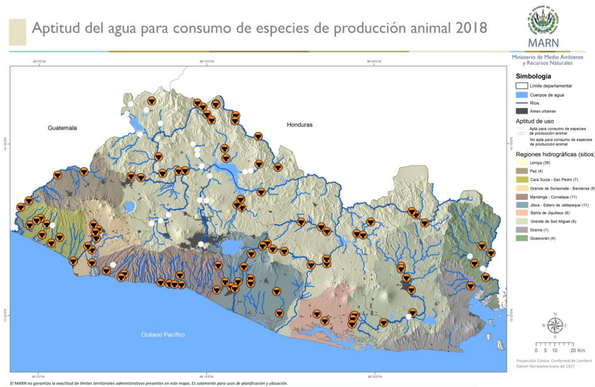
Figura 6. Resultados de calidad de agua para consumo de especies de producción animal

A continuación, se muestra el mapa de los resultados de la calidad de agua para consumo de especies de producción animal