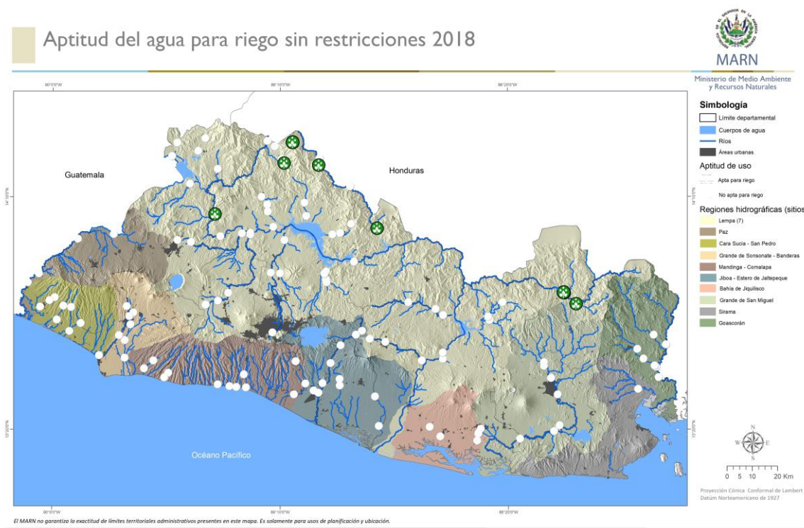
Figura 5. Resultados de calidad de agua para riego sin restricciones

A continuación, se muestra el mapa de los resultados de la calidad de agua para riego sin restricciones.