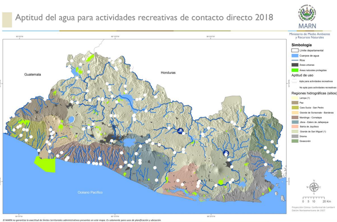
Figura 7. Resultados de calidad de agua para actividades recreativas con contacto directo

Los resultados de la calidad de agua muestran que dos sitios de los 122 sitios evaluados a escala nacional que cuentan con la calidad de agua para ser utilizada para actividades recreativas sin restricción, el restante 98 % de los sitios no cumplen debido a valores fuera de los valores guías de calidad de agua para: Coliformes fecales, Aceites y grasas, pH, Oxígeno disuelto y Turbiedad.