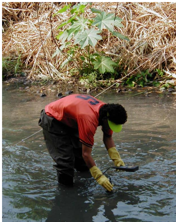
Figura 9. Análisis de parámetros en campo

seleccionado; luego las muestras son preservadas y trasladadas al Laboratorio de Calidad de Agua del MARN para su procesamiento el mismo día de la recolección.