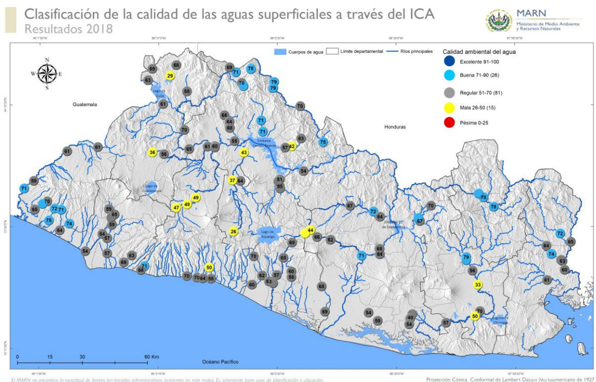
Figura 2. Calidad de agua valorada a través del Índice de Calidad de Agua (ICA) para el año 2018

A continuación, se muestran los resultados de la calidad del agua valorada a través de la aplicación del Índice de Calidad de Agua (ICA)